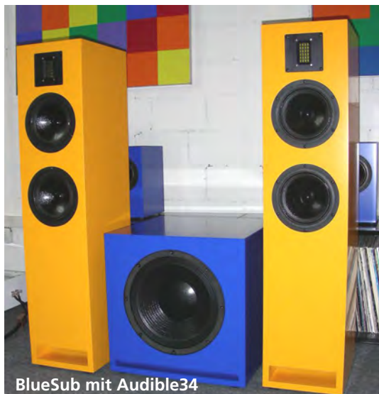
BlueSub mit Audible34

Selbstverständlich lassen sich mit BlueSub in Kombination mit anderen Lautsprechern wie z.B. Audible34 auch andere hervorragende, aktive 2.1 Systeme zu einem äusserst attraktiven realisieren.