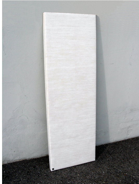
Leicht und einfach in der Montage